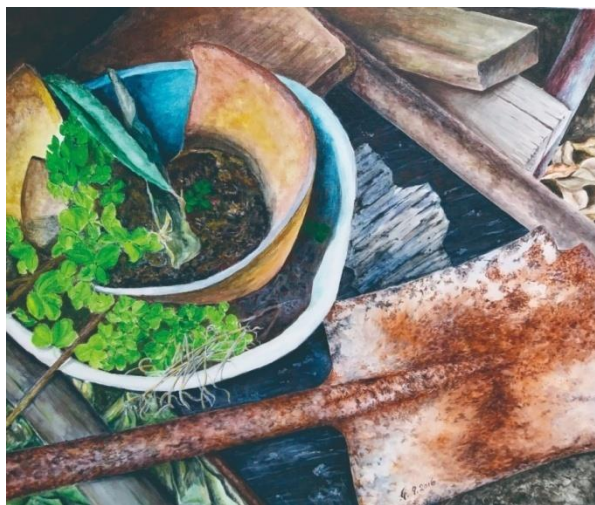
陳明東畫作 舊居一景

台灣中國文化大學美術系，曾任新藝畫會會長。 從事水彩畫創作，曾展出於香港文化中心高座、 香港圖書館展覽廳。現職設計印務。